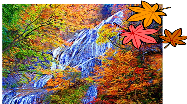
イメージ写真(姥ヶ滝)